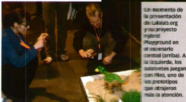
Un momento de la presentación de iFest'08. A la izquierda, los asistentes juegan con Pleo, uno de los prototipos que atrajeron más la atención.

Y como ejemplo señaló el éxito de compañías como Google, Yahoo o Linux, que utilizan la